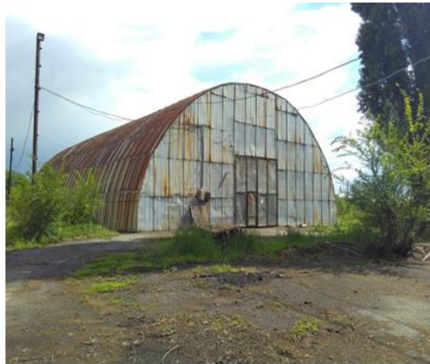
Здание арочного склада. Площадь застройки 480,1 м 2