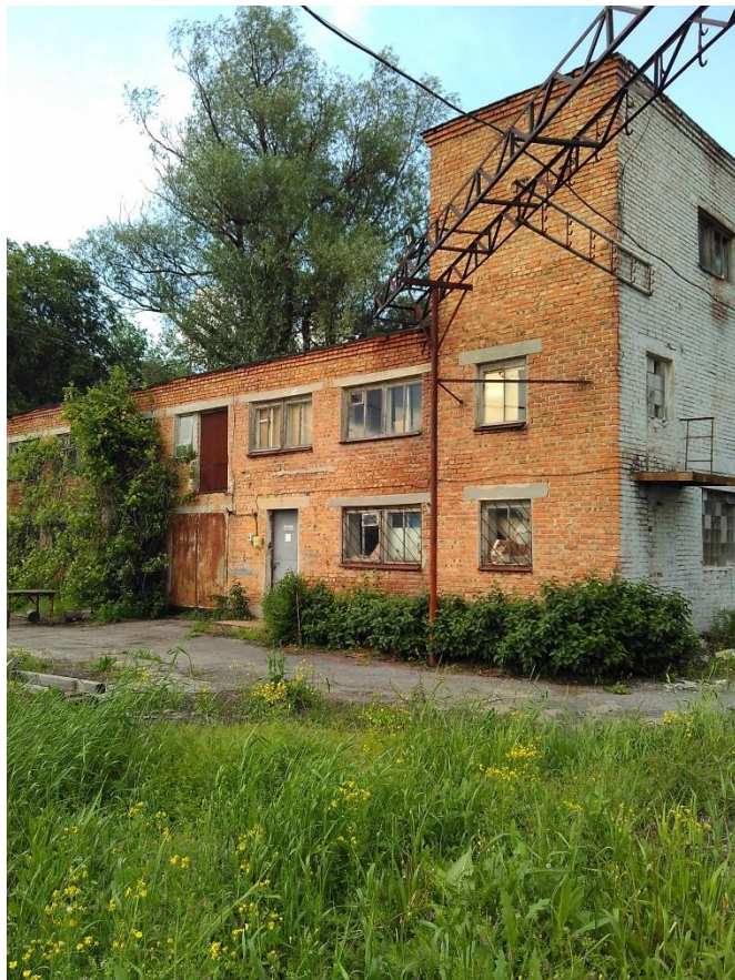
Здание Ремонтно-механического цеха.