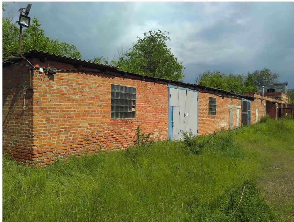
Здание склада. Площадь застройки 418,6 м2.