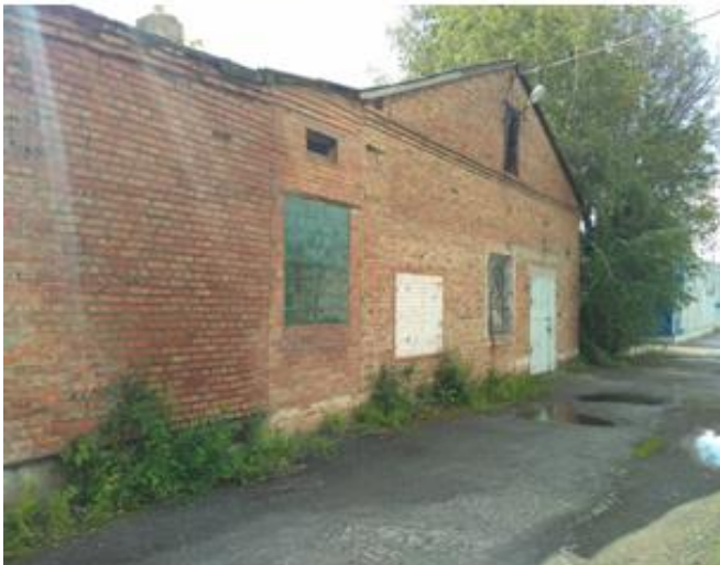
Здание рыбного цеха Площадь застройки 435,1 м2.