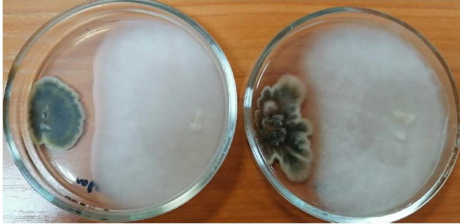
B.sorokinianai и F. equiseti