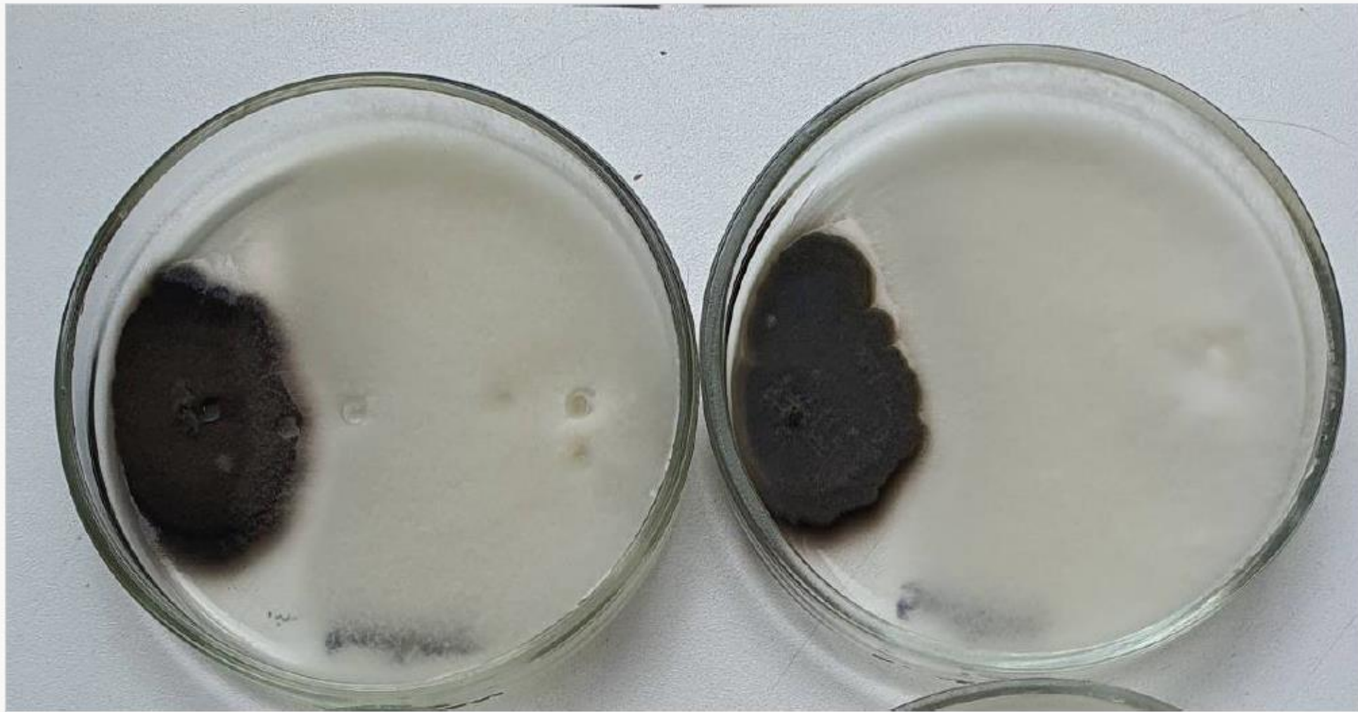
B. sorokinianai и F. oxysporum