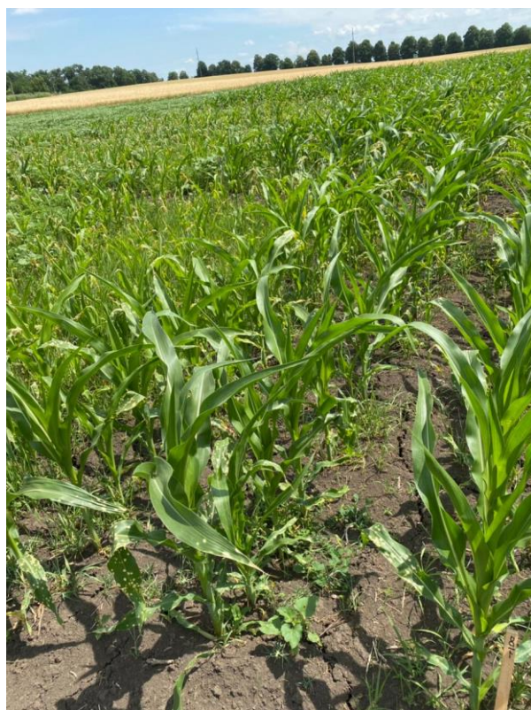
Изоксафлютол 225г/л+Тиенкарбазон-метил 90г/л+Ципросульфамид 150 г/л - 0,5л/га