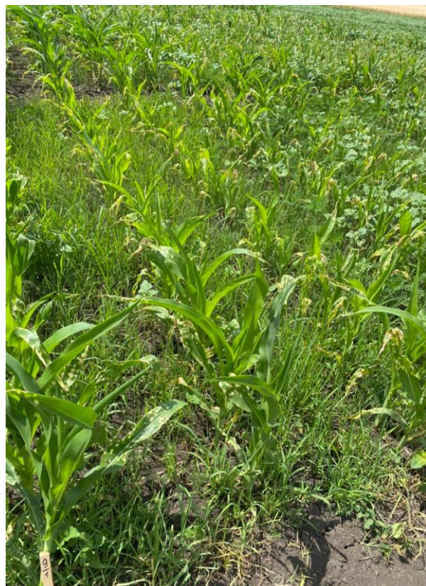
Мезотрион 37,5 г/л+С-метолахлор 375г/л+ Тербутилазин 125г/л – 4л/га