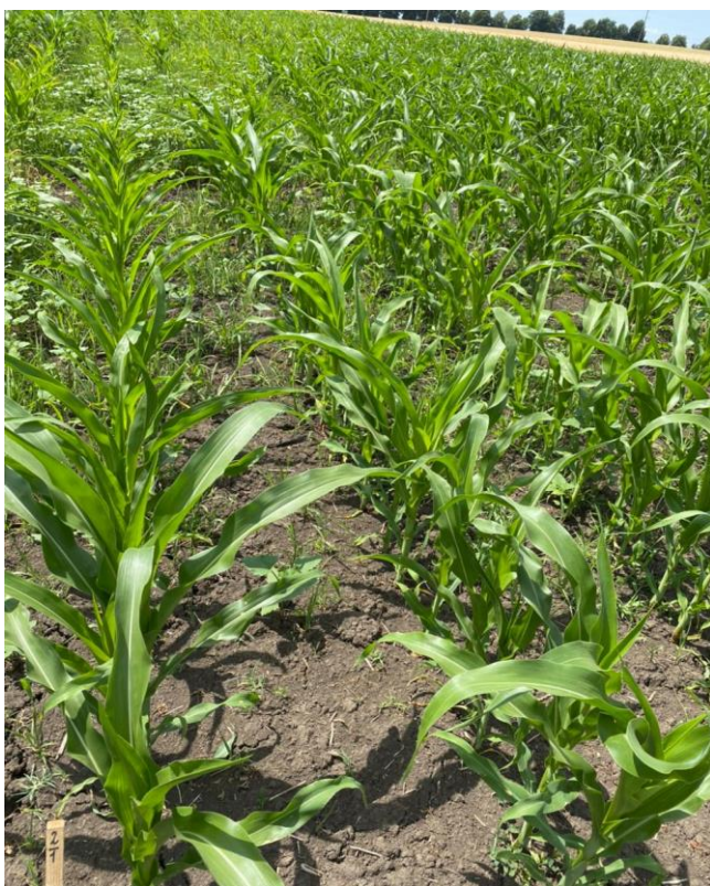
Клик 500 1,5л/га + Пропизохлор (720г/л) 2л/га