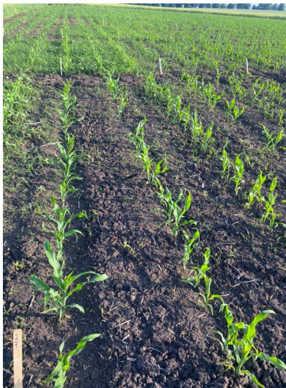
Клик 500 1,5л/га + Пропизохлор (720г/л)