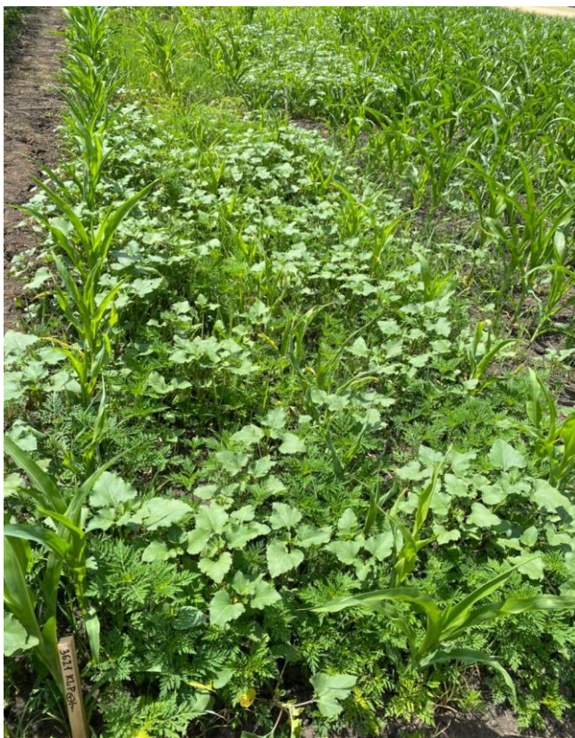
Контроль (вариант без обработки)