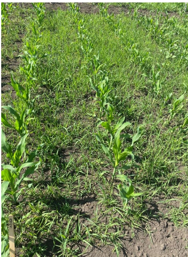
Мезотрион 37,5 г/л+С-метолахлор 375г/л + 90г/л+Тербутилазин 125 г/л - 4 л/га