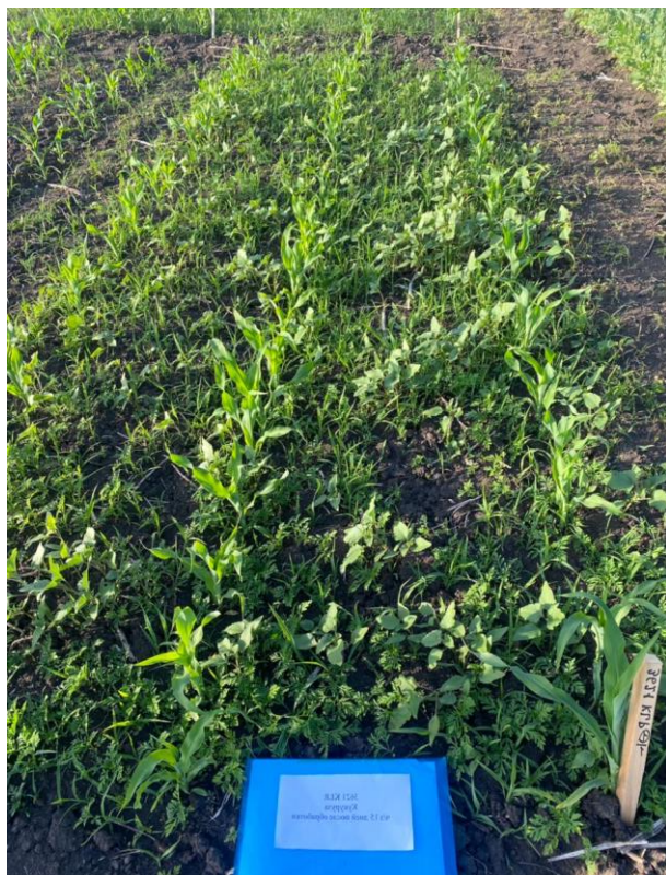
Контроль (вариант без обработки)